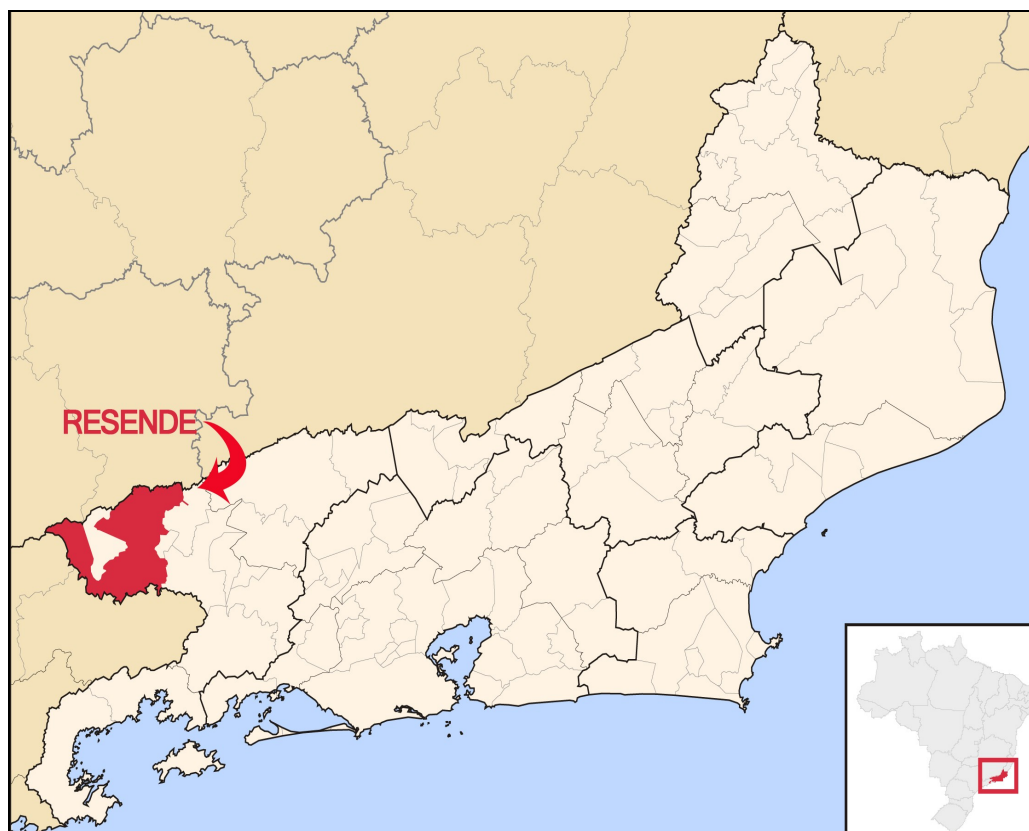
Mapa de Localização no Estado do Rio de Janeiro