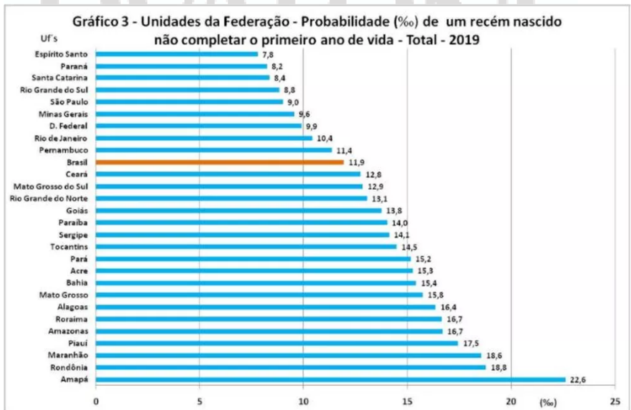
GRÁFICO DE MORTALIDADE INFANTIL POR FEDERAÇÃO

PROJEÇÃO da população do Brasil por sexo e idade para o período 2000-2060; Projeção da população das Unidades da Federação por sexo e idade 2000-2030. Rio de Janeiro: IBGE, 2013. Disponível em: < http://www.ibge.gov.br/home/estatistica/populacao/projecao_da_populacao/2013/default.shtm >. Acesso em: nov. 2015.